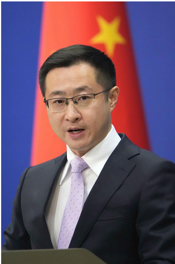
写真 = 共同通信社

記者会見する中国外務省の林剣副報道局長 = 2026年2月10日、北京 - 写真 = 共同通信社